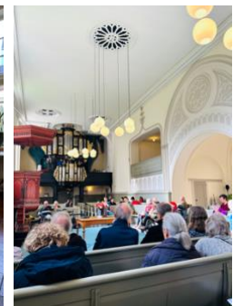
Jong talent concert