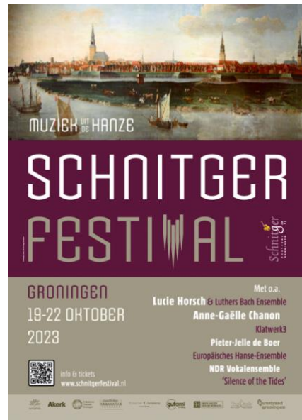
Affiche gemaakt door Geert de Koning

In de programmering was veel aandacht voor de destijds in verschillende Hanzesteden werkzame componisten die grote invloed hadden op de mondiale muziekgeschiedenis, zoals Heinrich Scheidemann (1595-1663) en Carl Philipp Emanuel Bach (1714-1788) uit Hamburg, Dieterich Buxtehude (1637-1707) en Franz Tunder (1614-1667) uit Lübeck, en Jan Pieterszoon Sweelinck (1562-1621) uit Deventer.