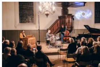
Klatwerk3 in de Lutherse Kerk

In de Volkskrant verscheen op maandag 22 oktober een recensie van de hand van Merlijn Kerkhof met de kop 'De bezoeker van het Schnitgerfestival wachtte een fantastisch orgel'