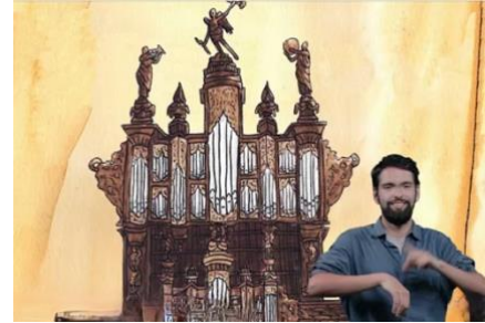
'Arp Schnitger zet de toon in Groningen'